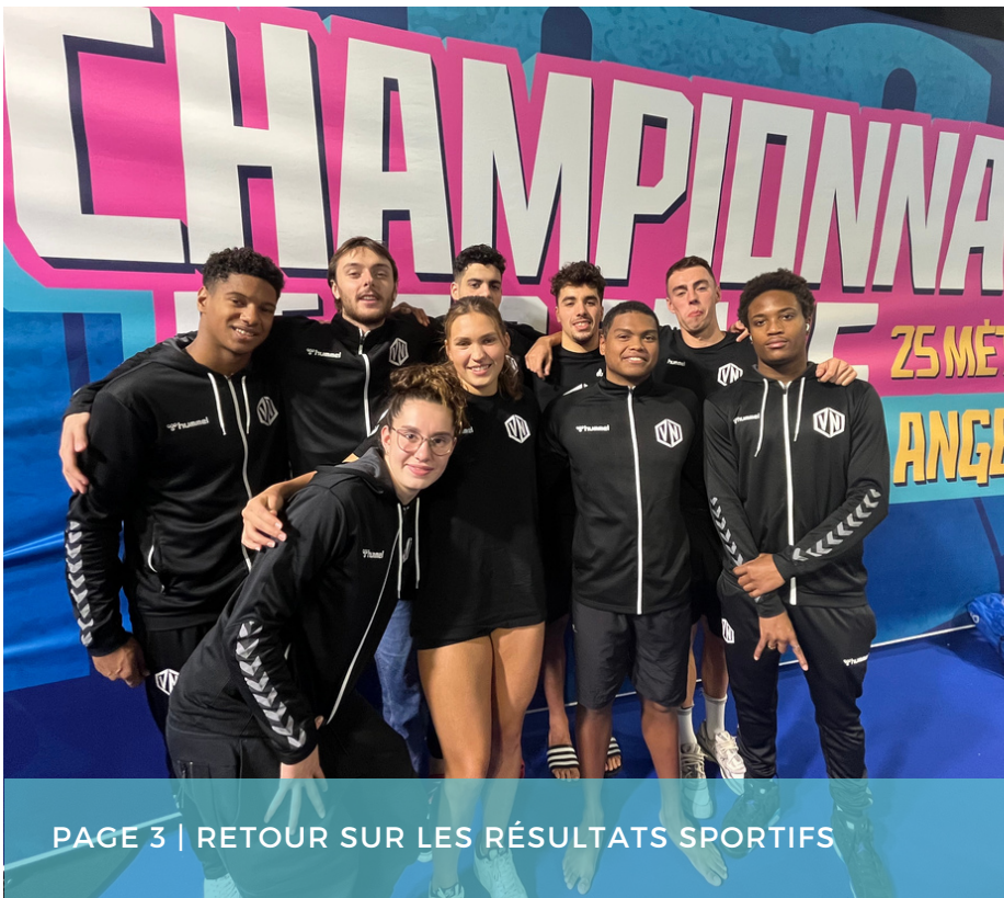
PAGE 3 | RETOUR SUR LES RÉSULTATS SPORTIFS