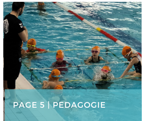
PAGE 5 | PEDAGOGIE