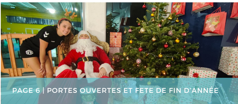
PAGE 6 | PORTES OUVERTES ET FETE DE FIN D'ANNÉE