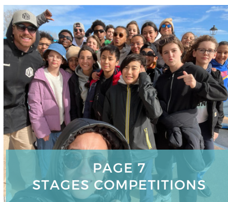
PAGE 7 STAGES COMPETITIONS