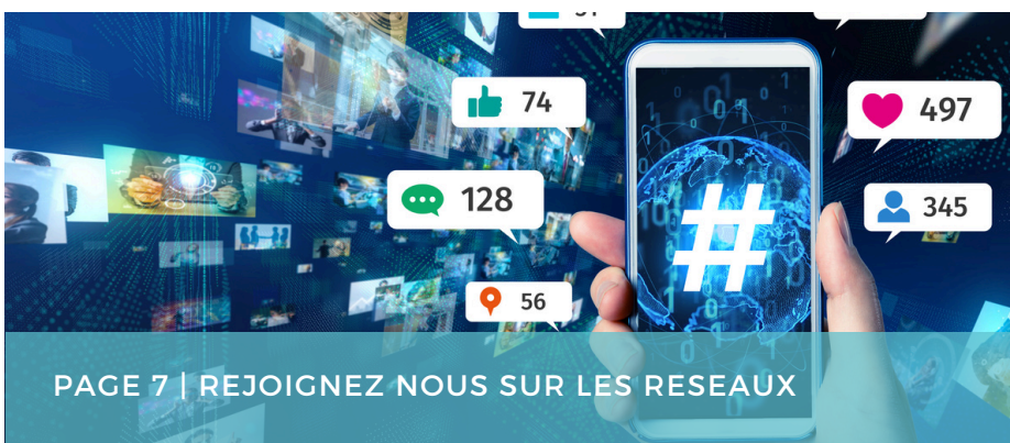
PAGE 7 | REJOIGNEZ NOUS SUR LES RESEAUX